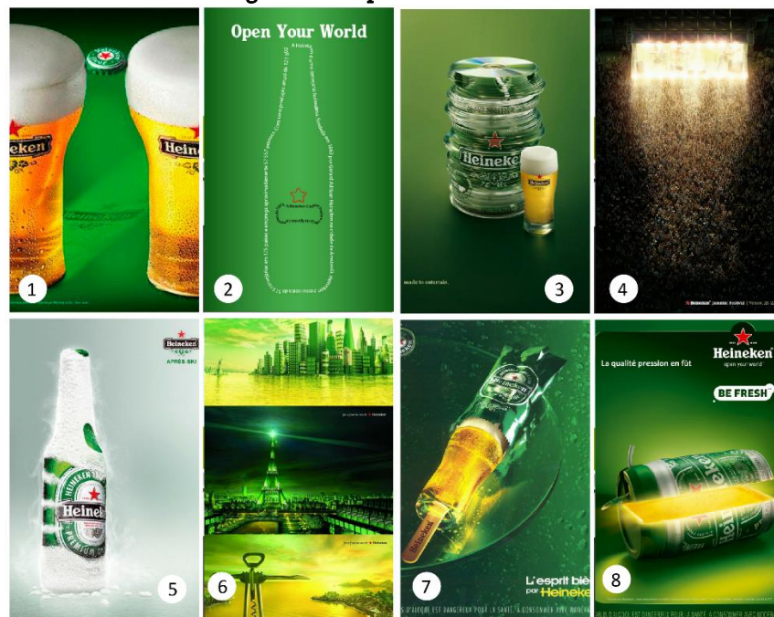
Figura 1. Campanhas analisadas

Utilizou-se como base as seguintes referências: Erro amostral 8%; nível de confiança 90%; população 10000 e percentual mínimo 39%. O questionário, com 09 perguntas, contou com a análise de 100 entrevistados de 08 imagens de campanhas com o uso da teoria, as interpretações de acordo com as leis básicas foram as seguintes: